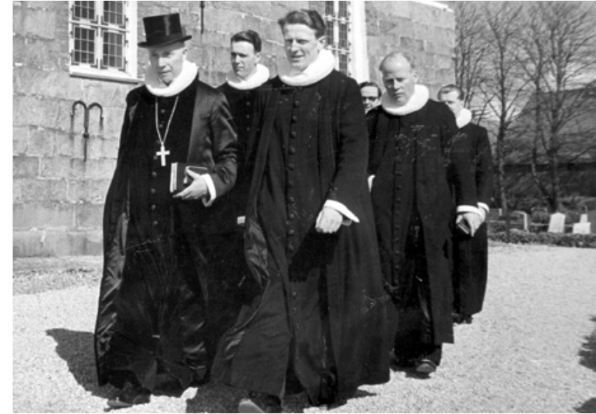
Det var både belastende og dybt formende at være søn af øvrigheden. Her min fars indsættelse som provst over hele Esbjerg-området.

Koblet sammen med sognebørnenes ærbødige reaktioner over for min far, som vi aflæste i deres anderledes behandling af os "præstesønner", fik han i mit tidlige sind en næsten mytisk status. Som præst og