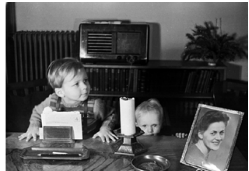
Dette billede er taget i 1950 på Bogholdervej, lige inden vi flyttede til Vestjylland. Skrivebordet, som min far selv havde tegnet og indrettet yderst fornuftigt til sit præstekontor, har jeg stadig i dag, ligesom alle tingene, der står på det. På radioen hørte jeg senere om Ungarnsoprøret mod Sovjet, inden den blev skiftet ud med en mere nutidig.