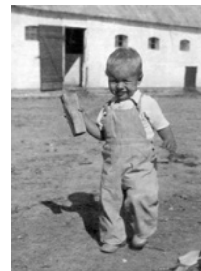
På den firelængede gård var der vidunderlige legemuligheder i laden med de gamle hestetrukne kareter, på kornloftet med sækkeliften og i den velduftende hestestald ved siden af det udendørs toilet og den udendørs mødding, der kunne lugtes i hele byen.