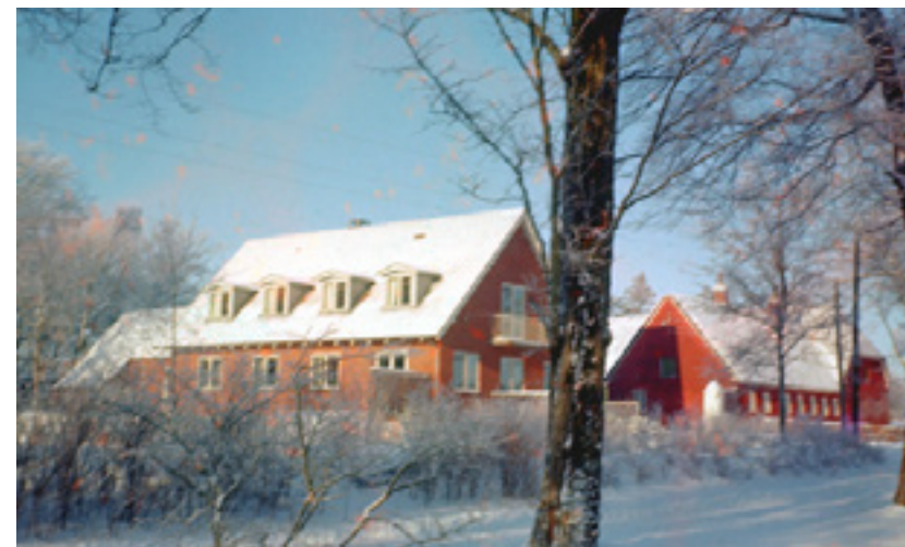
Den nye præstegård bygget oven på den gamle i to halvdele. Min bror og jeg elskede byggefasen, hvor vi fik lov at male på min mors fint tapetserede vægge i den gamle halvdel, vi boede i under byggeriet. Mit værelse er kvisten længst til venstre oven over min fars kontor og lige ved siden af barnepigeværelset. Det var disse kviste, vi sprang længdespring på, når far og mor var i kirke, og tagryggen højt oven over, vi balancerede på.