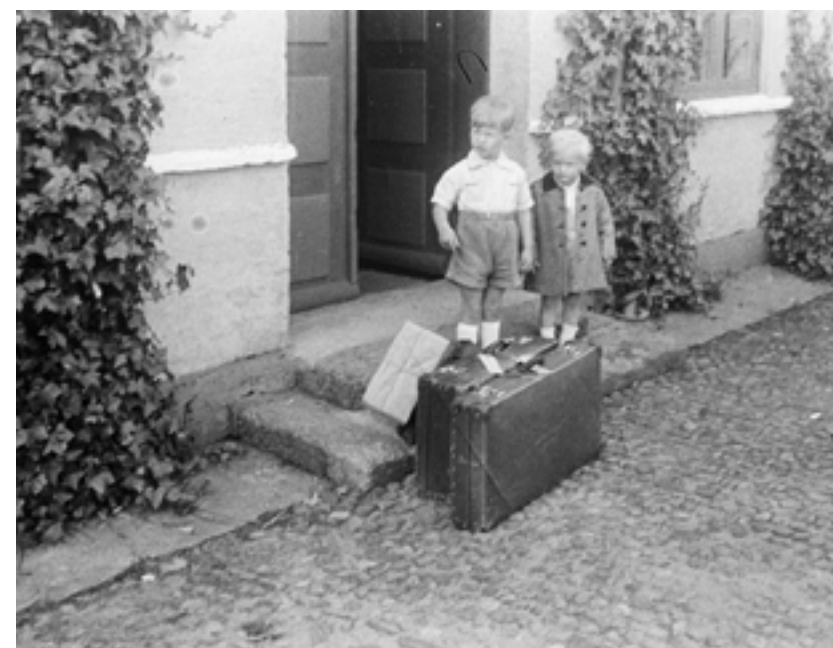
Forventningsfulde i toget på vej til Vestjylland 23. marts 1950 – en af de mest skelsættende datoer i mit liv. Fra en lille bitte københavnerlejlighed kunne vi nu stille vores rejsekufferter foran den gigantiske frihedsudvidelse af en gammel præstegård omgivet af tilhørende haver, skove, marker og moser.