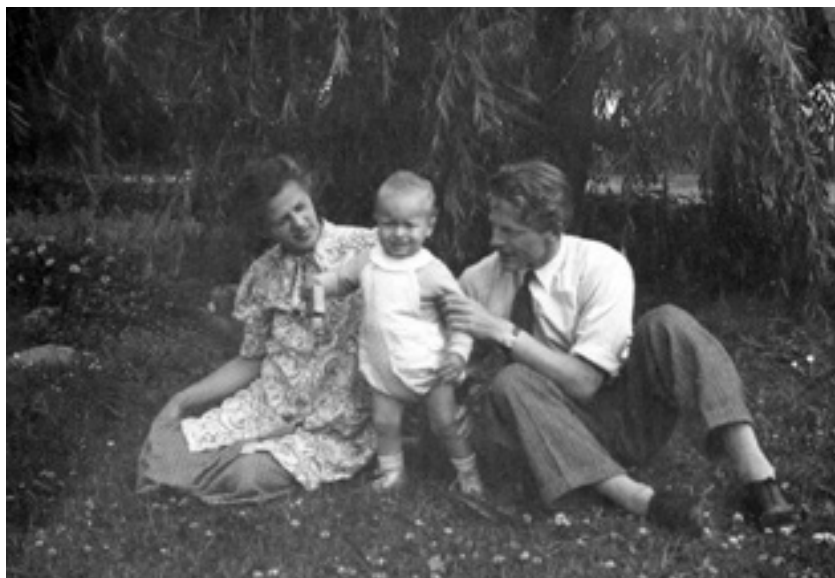
I haven på Marbjerggård med far og mor. Et år gammel.