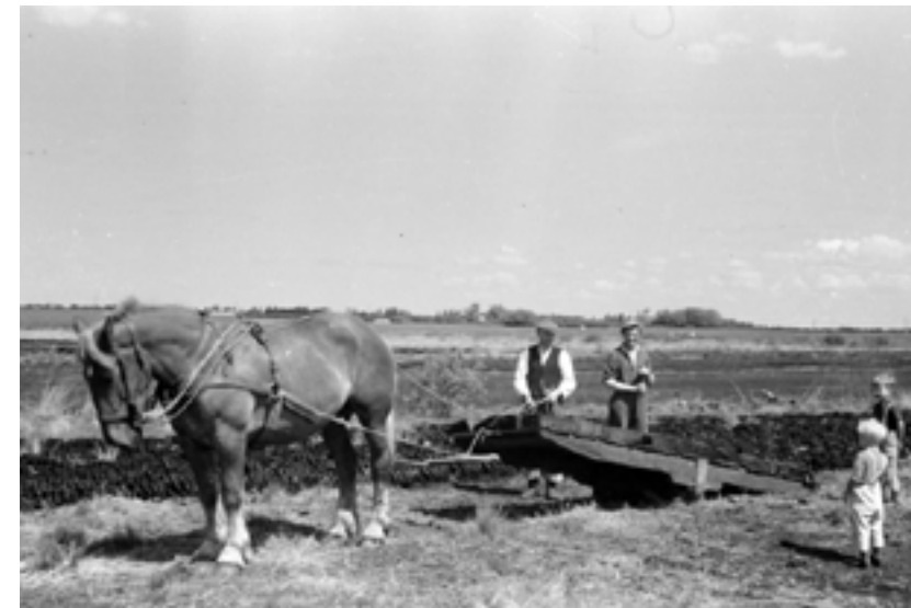
Vi er med Morten i præstegårdsmosen for at grave tørv. Før vi kom, var det forpagterens pligt – nærmest som under hoveriet – at forsyne præsten med 10 rummeter træ, og hvad der var brug for af tørv fra de 200 tønder land, der havde hørt til præstegården. Men Morten blev af gammel vane ved med at levere varme til os. Til gengæld hentede vi sammen med far juletræer i skoven hvert år til alle naboerne.