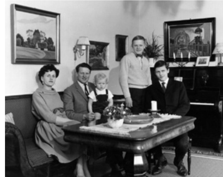
På overfladen åndede alt idyl, og det gjaldt om at holde den pæne facade udadtil. Sådanne glansbilleder har jeg tit siden fundet i selv de mest traumatiserede familier. Jeg er i mit konfirmationstøj her i 1961.