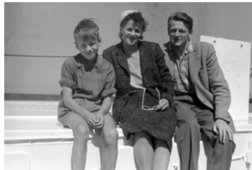
Med far og mor på Storebæltsfærgen på vej på sommerferie hos mine bedsteforældre i Marbjerg. Når vi nåede den afstressende færge, begyndte mor først at slappe af og muntert selv at glæde sig. Jeg har lige siden som foredragsholder forbundet færger med frihed, rejselyst, fællesskab og vigtigst af alt, de tvungne afstressende hvil, som er så vigtige for mennesker – hvorfor jeg ivrigt debatterede imod Storebæltsbroen i sin tid.