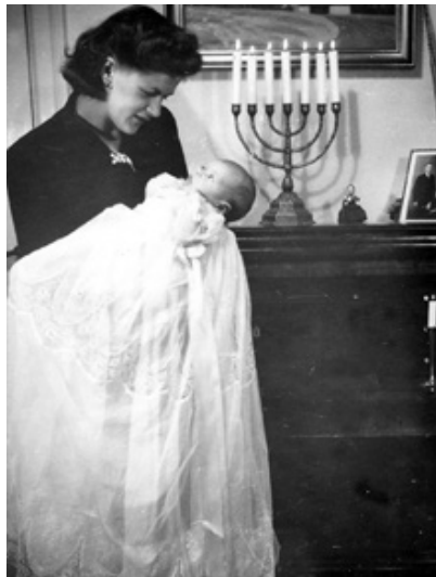
Vistnok det første billede af mig taget lige efter min barnedåb 8. juni 1947 i Grundtvigskirken, hvor min far var præst indtil 1950. Da det for mig rummer den oprindelige, men senere skadede kærlighed mellem min mor og mig, har jeg i min fotografering senere i livet ofte forsøgt at genskabe det tabte i sådanne klassiske mor og barn-billeder i andre familier.

På billederne fra den tid virker min mor allerede mindre munter og mere plaget end på de kåde ungdomsbilleder. Måske tilfældigt, for det må ikke glemmes, at udadtil og i de bedste stunder indadtil i familien