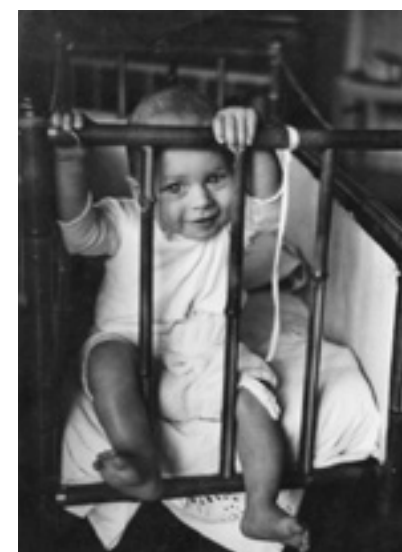
Tidligt tegn på frihedstrang.