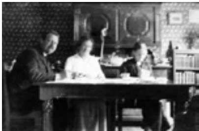
Min farfar og farmor skriver i 1919 invitationskort til deres forlovelse. I forlovelsesgave gav han hende det sofasæt, som jeg stadig slænger mig i hundred år efter i mit bogværelse i Gernersegade, omgivet af reolerne med hans og min anden "farfars" bøger og prædikener. Min far her til højre som præst i Grundtvigskirken er den sidste præst i familien, hvilket altid skuffede min farmor.