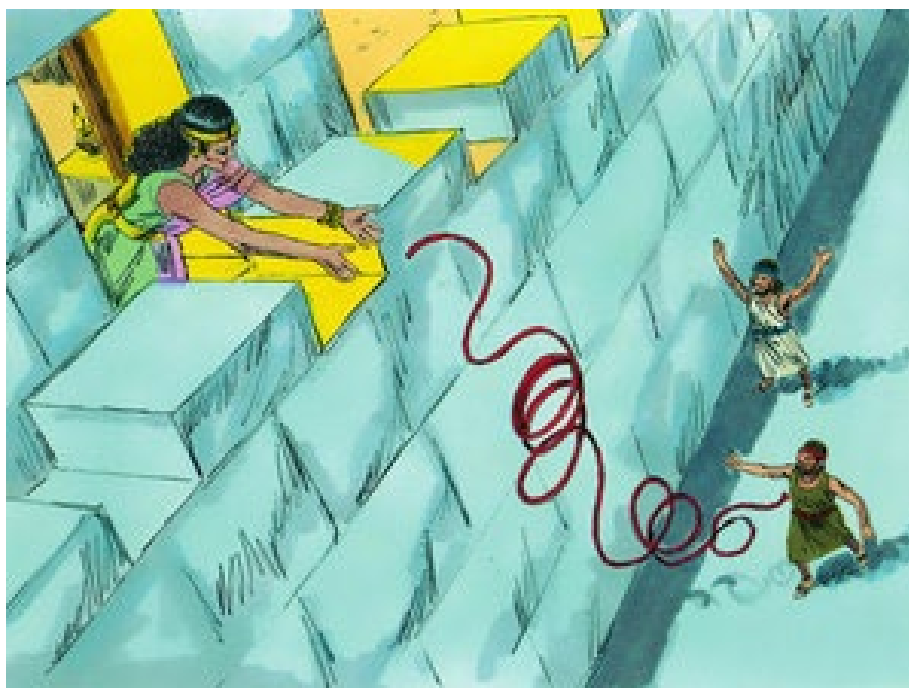
Bibels prostituerede Rahab