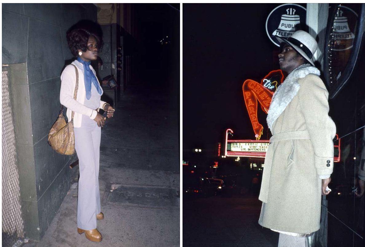
En af mine veninder fra bygningen på gaden udenfor og en alfons